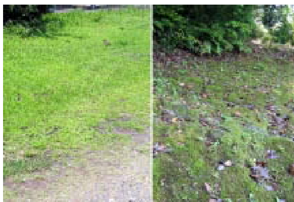
図1 日なた（左）と日陰（右）の地面の違い