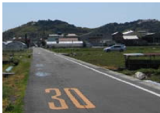
図2 翌日、水たまりは小さくなっている