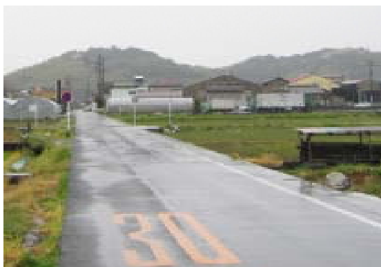
図1 雨の日、道路にできた水たまり