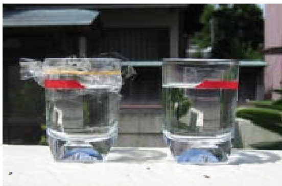
図3 おおいをした容器としない容器で比べる