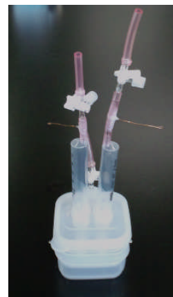
図3 電気分解容器による水素燃料電池